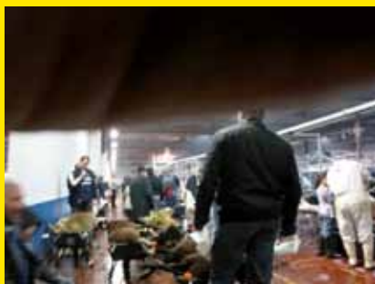
Van openheid is niet echt sprake tijdens de slachting van de schapen. Deze foto werd in het geheim genomen.

N aar aanleiding van het islamitisch offerfeest brachten Vlaams Parlementslid en Gents gemeenteraadslid Johan Deckmyn en Oost-Vlaams provincieraadslid en fractievoorzitter Tanguy Veys een onaangekondigd bezoek aan de Gentse slachtvloer in de leegstaande hallen van de voormalige UCO-fabriek (in de Bloemekenswijk). Doel van dit bezoek was om vast te stellen of alle wettelijke verplichtingen, waarop het Federaal Agentschap voor de Veiligheid van de Voedselketen (FAVV) moet toezien, werden nagekomen en er geen incidenten of inbreuken waren. Hierbij konden beiden er getuige van zijn dat er wel degelijk inbreuken op de regelgeving in-